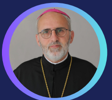
P.S. Ioan Călin Bot Episcop Greco-Catolic de Lugoj