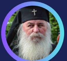
Î.P.S. Ioan Selejan, Mitropolit al Banatului